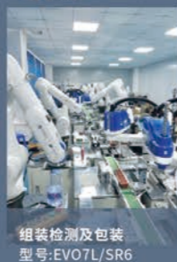
组装检测及包装 型号:EVO7L/5R6