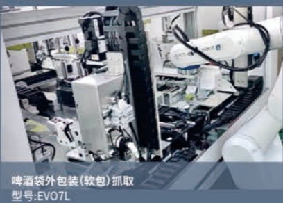
啤酒外包装(软包)抓取 型号:EVO7L