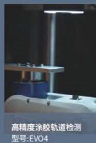
高精度涂胶轨道检测 型号:EVO4