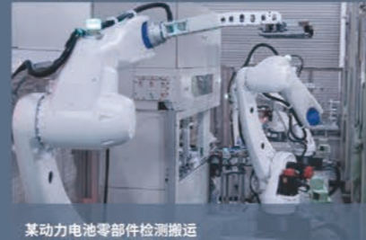
某动力电池零件检测搬运 型号:EVO25